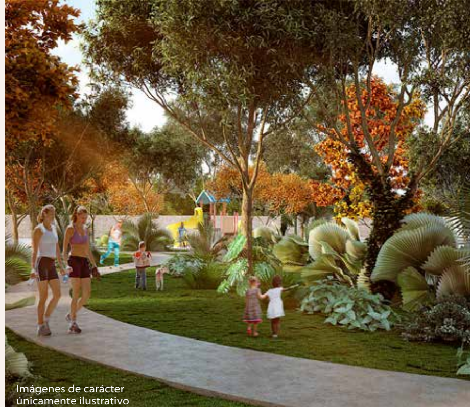
Imágenes de carácter únicamente ilustrativo