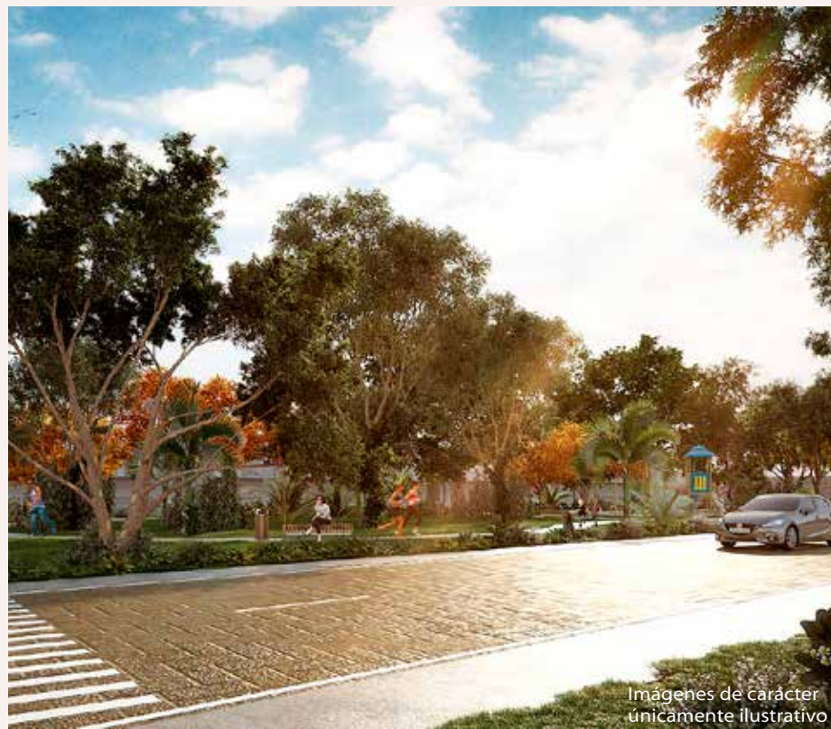
Imágenes de carácter únicamente ilustrativo