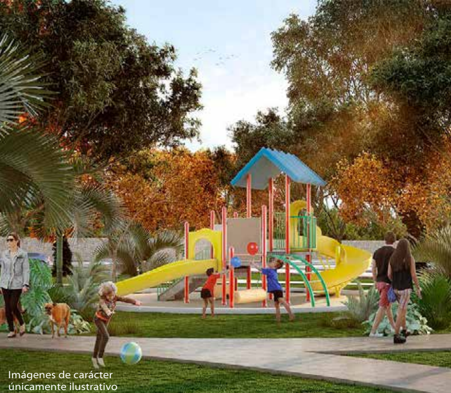
Imágenes de carácter únicamente ilustrativo