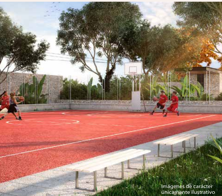
Imágenes de carácter únicamente ilustrativo